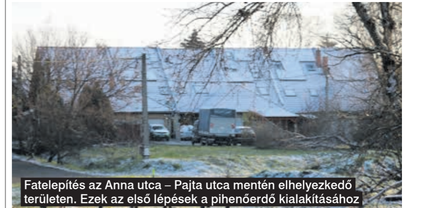
Fatelepipítés az Anna utca – Pajta utca mentén elhelyezkedő területen. Ezek az első lépések a pihenőerdő kialakításához

„Az el nem adott helyiségeket az átminősítés után lakóingatlanként lehet eladni.”