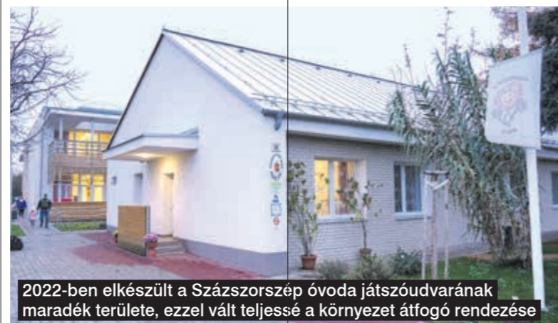
2022-ben elkészült a Százszorszép óvoda játszóudvarának maradék területe, ezzel vált teljessé a környezet átfogó rendezése

Decemberben adtak át hivatalosan egy újabb kutyafuttatót az Újlak utcában, ami a lakótelepen élők számára könnyebbé, hiszen itt nagyon sok kutyatartó van, akiknek eddig nem volt lehetőségük arra, hogy szabadon engedhessék kedvenceiket közterületen. Ez a fej-