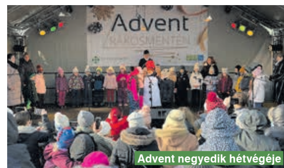
Advent negyedik hétvégéje