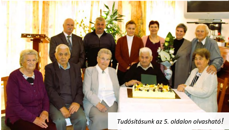
Tudósításunk az 5. oldalon olvasható!