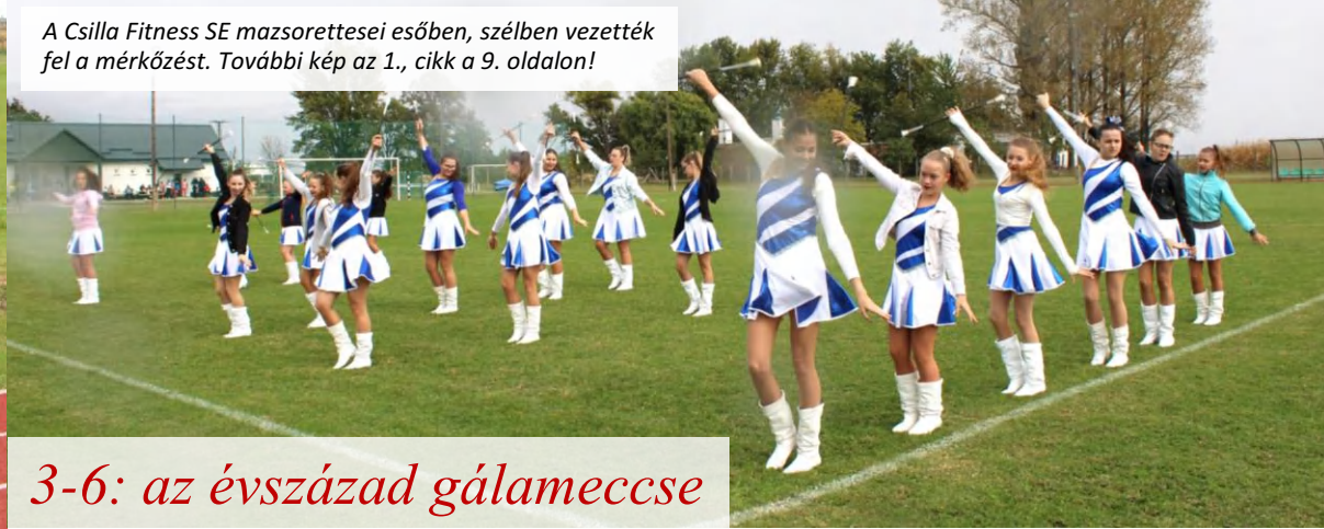
A Csilla Fitness SE mazzorettesei esőben, szélben vezették fel a mérkőzést. További kép az 1., cikk a 9. oldalon!