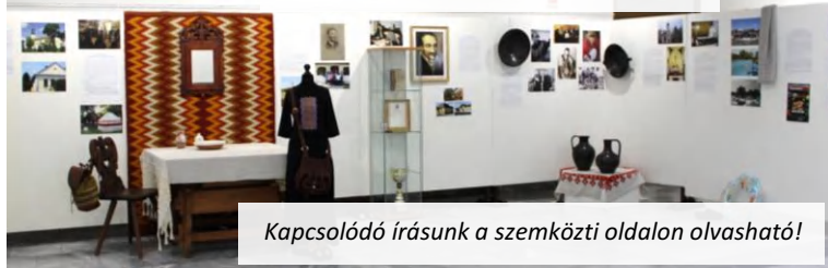
Kapcsolódó írásunk a szemközti oldalon olvasható!