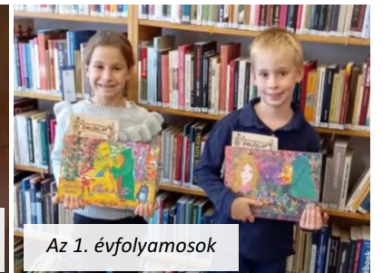
Az 1. évfolyamosok