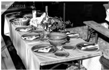
A mieink szép terítése még Debrecen polgármesterének, Papp Lászlónak Facebook-oldalán is feltűnt!

„– Eddig csak egy találkozó, a tavalyin nem volt itt Nádudvar városa. Most