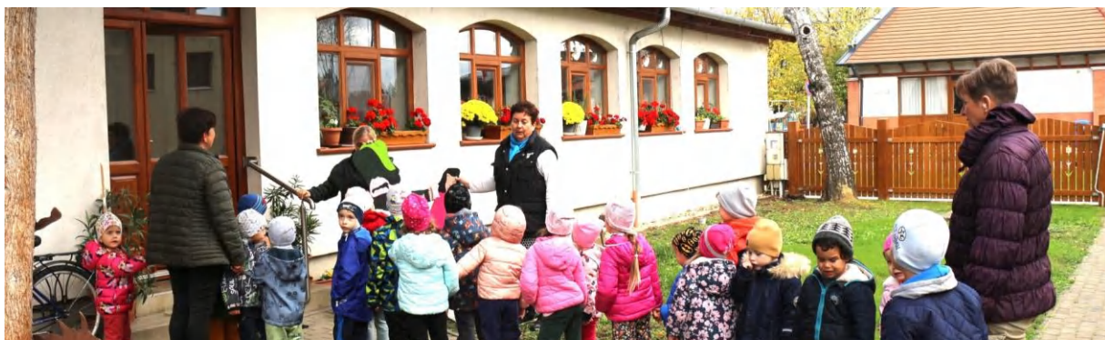
Márton-napra hangolódva a Napfény ovisok is bekukkantottak a Kincsházba. A kép háttérének a szép, új kerítés szolgált.

A november 11-ei Márton-napi Ludasságok című programkavalkádról decemberi lapszámunkban tudunk részletesen beszámolni.