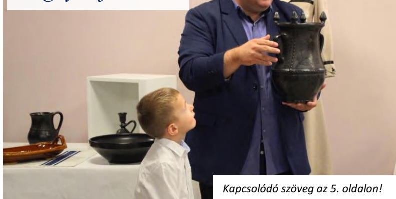
Kapcsolódó szöveg az 5. oldalon!