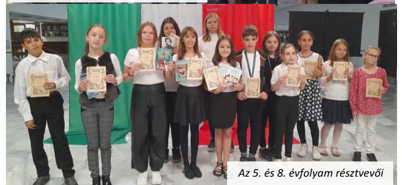
Az 5. és 8. évfolyam résztvevői