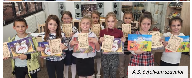
A 3. évfolyam szavalói