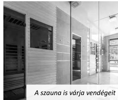
A szauna is várja vendégeit

A Nádudvari Strand Büfé november-től, bővített kínálattal (egyebek mellett – ahogy a képen látható – frissen sült hekkel is) várja vendégeit és továbbra is lehet telefonos rendelést leadni náluk nyitvatartási idejükben, azaz minden nap 10.30-tól 18 óráig a +36 30 575 3478-as telefonszámon.