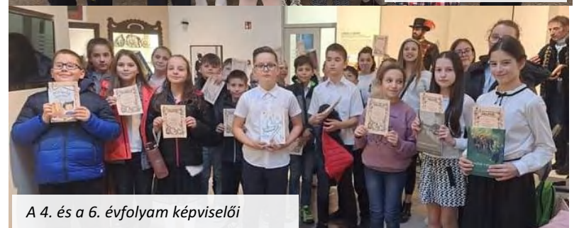
A 4. és a 6. évfolyam képviselői