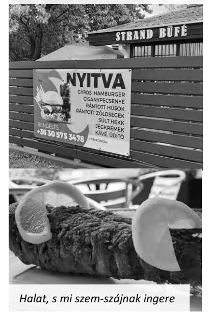
Halat, s mi szem-szájnak ingere