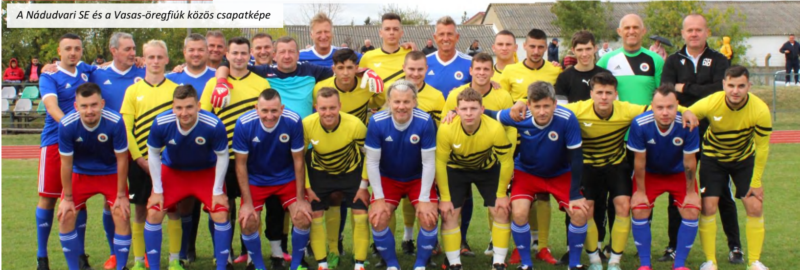
A Nádudvari SE és a Vasas-öregfiúk közös csapatképe