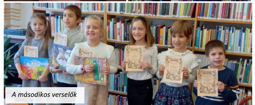
A másodikos verselők