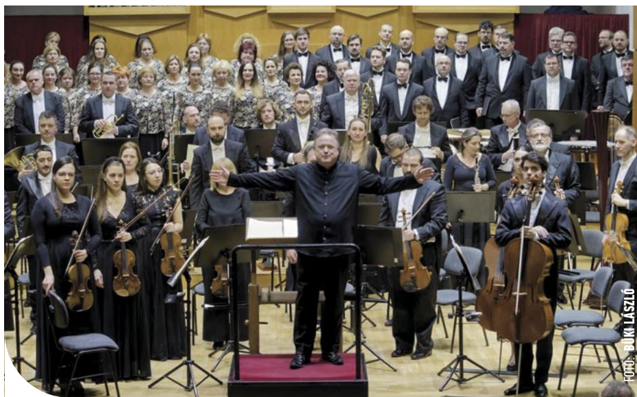
☉ Pazar koncerteket adott a Savaria Szimfonikus Zenekar